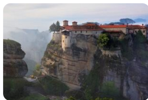
梅黛奥拉天空之城

(注：6座修道院的开放时间各不相同，视当天情况选择可以参观的修道院，一般参观2座修道院。修道院有严格的着装规定，不得裸露肩膀或膝盖，女性必须穿裙子。如果没有裙子，修道院门口提供围裙可以借用，请在入场前借一条。)