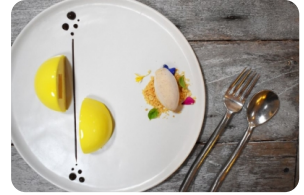
Mango Passion Fruit Sphere