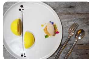
Mango Passion Fruit Sphere