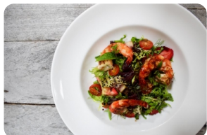
Garden Mesclun And Prawns