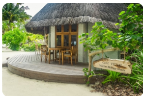
Gili Veshi 海洋生物工作室