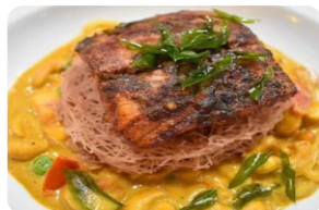
Grilled Sri-Lankan Reef Fish Fillet