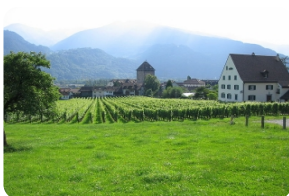
迈恩费尔德——童话小镇