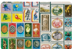
列支敦士登邮票博物馆