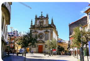
布拉加共和国广场