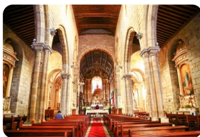
奥利维拉圣母教堂