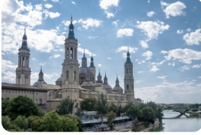
比拉尔圣母大教堂