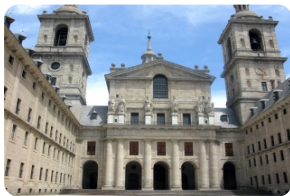
埃斯科里亚尔修道院