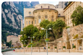
蒙特塞拉特修道院