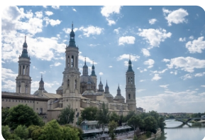
比拉尔圣母大教堂