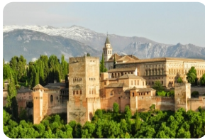
阿尔罕布拉宫 [阿尔罕布拉宫]

阿尔罕布拉宫，又叫“红堡”，是阿拉伯式宫殿庭院的代表，位于格拉纳达城外的内华达山上。作为伊斯兰教建筑与园艺完美结合的建筑，阿尔罕布拉宫早在1984年就已经被联合国教科文组织选入世界文化遗产名录之中。