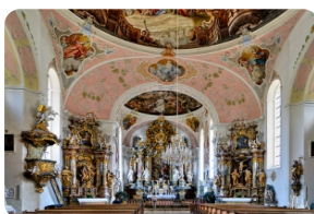
圣彼得和保罗教堂