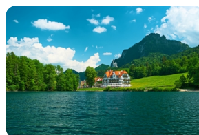
阿尔卑斯湖【新天鹅堡】