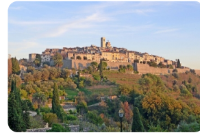
圣保罗·德旺斯--与艺术的一场美丽邂逅