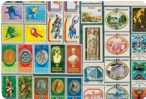
列支敦士登邮票博物馆