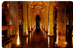
耶莱巴坦地下水宫