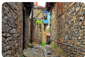
朱马勒克兹克小镇