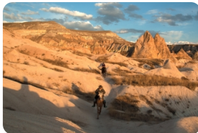
格雷梅露天博物馆