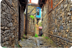
朱马勒克兹克小镇