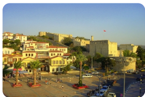
守望爱琴海的古老遗迹——切什梅城堡