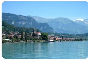
布里恩茨湖---瑞士最纯净的湖