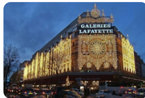
老佛爷百货公司 (奥斯曼旗舰店)