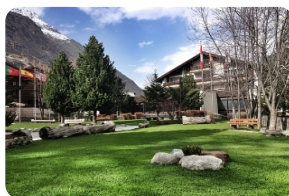
文根小镇--阿尔卑斯山风情的童话小镇