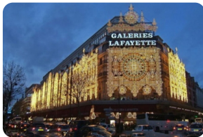
老佛爷百货公司（奥斯曼旗舰店）