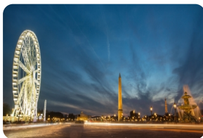
协和广场 [香榭丽舍大街]