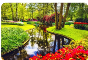
库肯霍夫郁金香花园