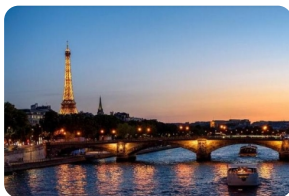
【重点推荐】巴黎夜游