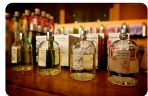
巴黎花宫娜香水博物馆