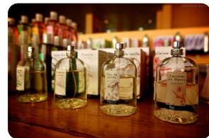
巴黎花宫娜香水博物馆