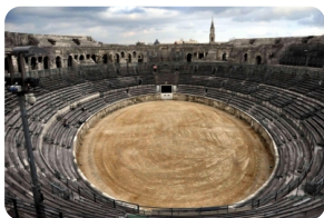
尼姆古罗马竞技场