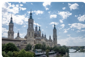
比拉尔圣母大教堂