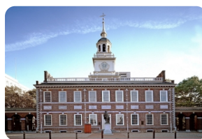
费城国家独立历史公园