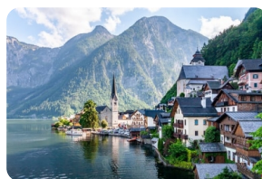
明信片上的小镇——哈尔斯塔特