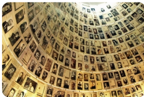
犹太大屠杀纪念馆