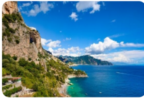
阿马尔菲北部海岸线