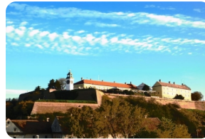
彼德罗瓦拉丁堡垒