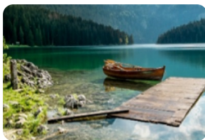
杜米托尔国家公园黑湖 [杜米托尔国家公园黑湖]