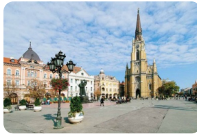
诺维萨德自由广场