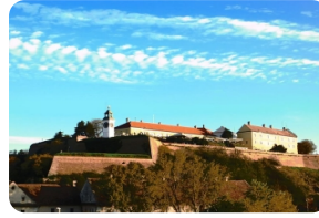
彼德罗瓦拉丁堡垒