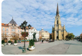
诺维萨德自由广场