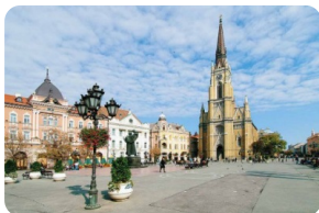
诺维萨德自由广场