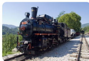
Sargan 8 铁路