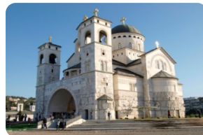
波德戈里察大教堂