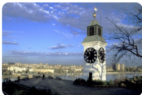
彼得罗瓦拉丁要塞

注：本网页内所标注时间均为参考时间，实际抵达时间会因各种不可抗力原因如天气，堵车，交通意外，节日赛事，骚乱罢工等有晚点可能，请您谅解。您如有后续行程安排需搭乘其他交通工具前往其他城市，我们强烈建议您至少预留3小时以上的空余时间，以免行程延迟受阻为您带来不便。由于您没有预留足够的空余时间而导致的自行安排行程有所损失，我公司概不负责，敬请谅解。