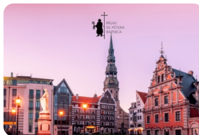
里加圣彼得大教堂