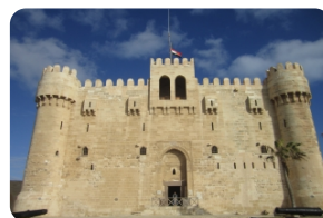
盖贝依城堡 (亚历山大灯塔遗址)