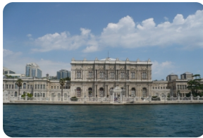
多玛巴赫切新皇宫