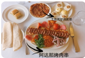
土耳其阿达那烤肉串