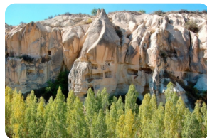
格雷梅露天博物馆