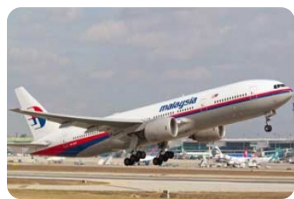
伊斯坦布尔阿塔图尔克机场（机场代码IST）