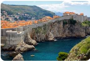
杜布罗夫尼克城墙