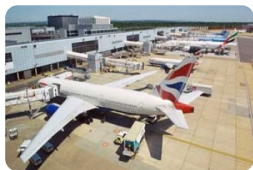
阿塔图尔克机场 Istanbul Ataturk Airport（机场代码IST）

景点包含：乘船游览博斯普鲁斯海峡欣赏亚洲和欧洲两岸风光，品尝美味的土耳其烤肉午餐，游览塔克西姆广场，步行于Ortakoy大街，外观多玛巴赫切新皇宫拍照留念。之后游览美丽的金角湾，乘坐缆车登上洛蒂山瞰整个伊斯坦布尔城区，在山上的咖啡馆自费品尝地道的土耳其咖啡。