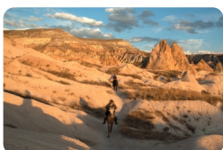
格雷梅露天博物馆

***今日贵宾可（自费）乘坐热气球：热气球随风飞向卡帕多奇亚的山谷，进行一次神奇的空中之旅，高空欣赏世界上唯一的卡帕多奇亚的精灵烟囱，仿佛置身于另一个世界，在村庄、葡萄园，果园点缀的“月球表面”上空徘徊大约45分钟至1小时，最后在农夫的田地中着陆。着陆后当地给每人颁发一份证书，并赠送一杯香槟庆祝这次成功的空中历险。