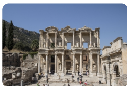
以弗所(埃菲斯)古城遗址