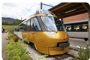
金色山口快车 Golden Pass Line