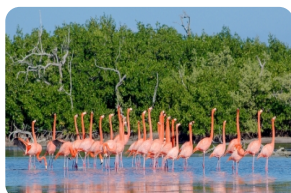
拉加托斯景区 (Ria Lagarto)