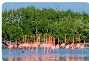
拉加托斯景区 (Ria Lagarto)