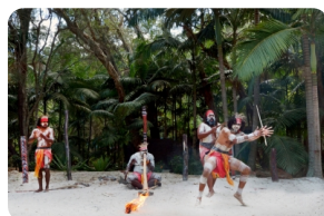
查普凯土著文化园