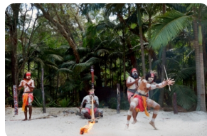
查普凯土著文化园