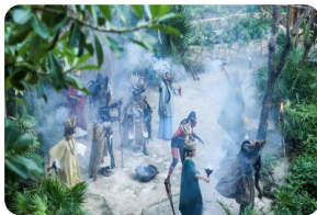
西卡莱特主题公园

以上行程时间安排可能会因天气、路况等原因做相应调整，敬请谅解；如出行当天您有返程计划（乘飞机或火车等）请提前与我社说明，以免耽误您的行程。