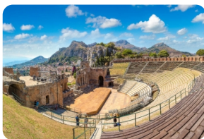
希腊露天圆形剧场