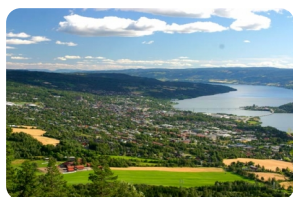
利勒哈默尔市区观光