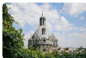
瓜达卢佩圣母大教堂