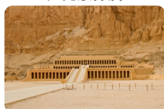
哈特谢普苏特女王神庙