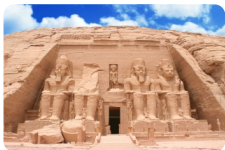
阿布辛贝大小神殿

上午您可以选择在游轮上好好地休息或是游玩阿斯旺城，我们更加推荐您自费参观埃及知名的【阿布辛贝大小神殿】。中午回到游轮上享受午餐和短暂休息之后，下午前往位于科翁坡市的【科翁坡神庙】，全埃及乃至整个世界至古老的一个日历图案就保存在神庙当中。