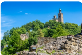
大特尔诺沃古城堡