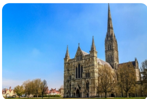
圣彼得和圣保罗大教堂