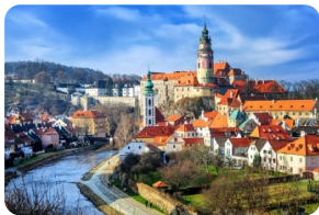
CK小镇--中世纪童话小镇