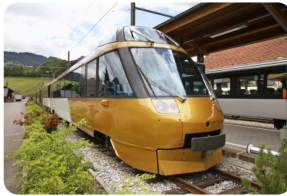
金色山口快车 Golden Pass Line