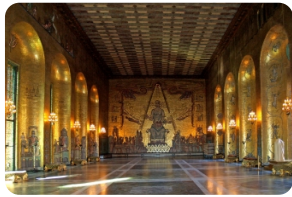
斯德哥尔摩市政厅---诺贝尔晚宴会场

*斯德哥尔摩-赫尔辛基往返邮轮：了解更多关于游轮舱位设施，请访问 https://virtualtour.tallink.com/silja-symphony/ 。部分团组使用Viking邮轮。