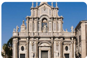
大教堂广场和圣阿加塔大教堂