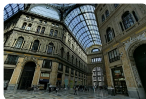
翁贝托一世拱廊街