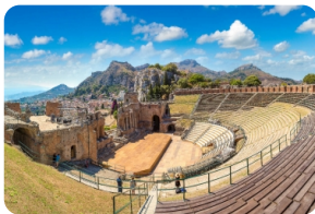
希腊露天圆形剧场